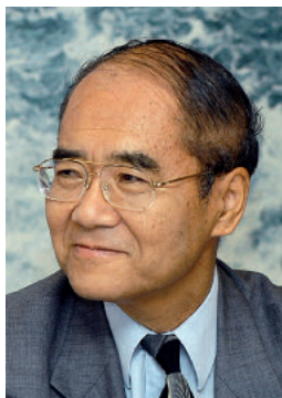
Koichiro Matsuura UNESCO Director-General

The first half of the UN Decade of Education for Sustainable Development (DESD) has seen concerted efforts to integrate the principles, values and practices inherent in sustainable development into all aspects of education and learning. With the DESD approaching its mid-point, now is the time for UNESCO Member States, UN agencies, civil society organizations, youth and the private sector to come together to review the accomplishments of the DESD so far. Taking stock of the Decade's implementation will help determine what impact the DESD is having and how that impact can be made even greater. The Conference also aims to deepen exchange and collaboration among DESD stakeholders, as well as to highlight the contribution of ESD to all types, levels and settings of education.