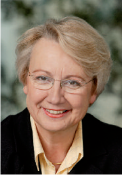
Annette Schavan German Federal Minister of Education and Research

Education is key to sustainable development. Education enables each individual to acquire knowledge and values as well as behaviour patterns and lifestyles that are essential for a liveable future and for developing a sustainable society. The German Federal Ministry of Education and Research and UNESCO invite participants to take part in the World Conference on Education for Sustainable Development – Moving into the Second Half of the UN Decade in the United Nations and Federal City Bonn. At the Conference, crucial decisions will be made to set the course of direction for the second half of the UN Decade.