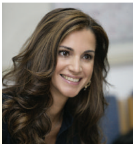
Sa Majesté, la Reine Rania Al-Abdullah de Jordanie