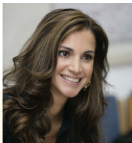
Her Majesty Queen Rania Al Abdullah of Jordan