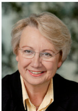
Annette Schavan German Federal Minister of Education and Research

L'éducation est la clé du développement durable. En effet, l'éducation permet d'acquérir des connaissances et des valeurs, mais aussi d'assimiler des comportements et des modes de vie indispensables pour un avenir digne d'être vécu et la construction d'une société viable. En partenariat avec l'UNESCO, le Ministère fédéral de l'Éducation et de la Recherche organise la Conférence mondiale de l'UNESCO sur l'éducation pour le développement durable – S'engager dans la seconde moitié de la Décennie des Nations Unies à Bonn, ville de l'ONU. Cette conférence est appelée à préparer le terrain pour la seconde moitié de la Décennie des Nations Unies.