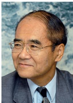
Koichiro Matsuura UNESCO Director-General

Cette première moitié de la Décennie des Nations Unies pour l'éducation au service du développement durable (DEDD) a vu de sérieux efforts pour intégrer les principes, les valeurs et les pratiques du développement durable dans tous les aspects de l'éducation et de l'apprentissage. Alors que nous nous apprêtons à célébrer les cinq ans de la Décennie, le temps est venu pour les états membres de l'UNESCO, les agences des Nations Unies, les organisations de la société civile, la jeunesse ainsi que le secteur privé, de se rassembler afin de passer en revue les réalisations de la DEDD accomplies jusqu'ici. Dresser le bilan de la mise en œuvre de la Décennie aidera à déterminer son impact actuel, ainsi que la manière de rendre cet impact encore plus important. La conférence vise également à approfondir les échanges et la collaboration entre les parties prenantes de la DEDD ainsi qu'à mettre en évidence la contribution de l'éducation pour le développement durable (EDD) à toutes les formes, tous les niveaux et tous les contextes éducatifs.